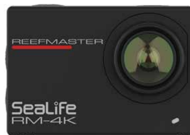
Kompakte, herausnehmbare Innenkamera