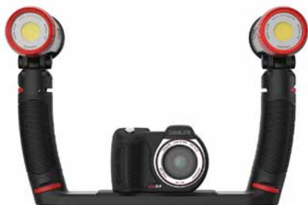
35.101.553 - MICRO 3.0 PRO DUO 5000

Set beinhaltet die Micro 3.0 Kamera, zwei Sea Dragon 2500F Lampen, eine Doppelschiene mit zwei Griffen in einem Pro Duo Case.