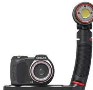
35.101.552 - MICRO 3.0 PRO 3000 AUTO

Set beinhaltet die Micro 3.0 Kamera, zwei Sea Dragon 2500F Lampen, eine Doppelschiene mit zwei Griffen in einem Pro Duo Case.