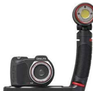
35.101.552 - MICRO 3.0 PRO 3000 AUTO

Set beinhaltet die Micro 3.0 Kamera, zwei Sea Dragon 2500F Lampen, eine Doppelschienen mit zwei Griffen in einem Pro Duo Case.