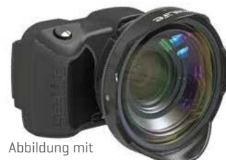
Abbildung mit Micro 3.0