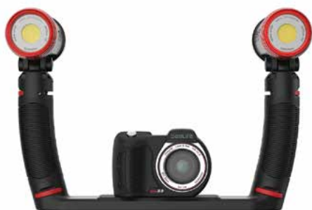
35.101.553 - MICRO 3.0 PRO DUO 5000

Set beinhaltet die Micro 3.0 Kamera, zwei Sea Dragon 2500F Lampen, eine Doppelschienen mit zwei Griffen in einem Pro Duo Case.