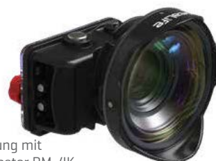
Abbildung mit Reefmaster RM-4K