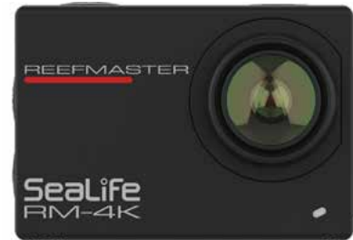
Kompakte, herausnehmbare Innenkamera